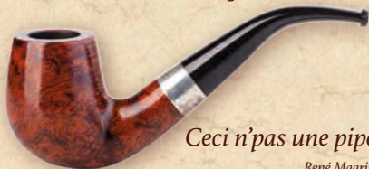
Ceci n'pas une pipe. René Magritte