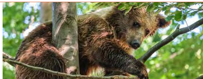
Bärenpark Worbis

Weitere Informationen unter 05525 439 15 48, 0160 820 29 46 oder www.seggytours.eu .