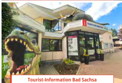
Tourist-Information Bad Sachsa