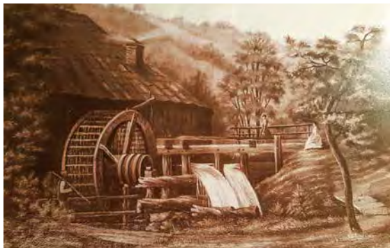
Die Schuchardt'sche Blankschmiede Standort heutige Sebastian Kneipp Promenade