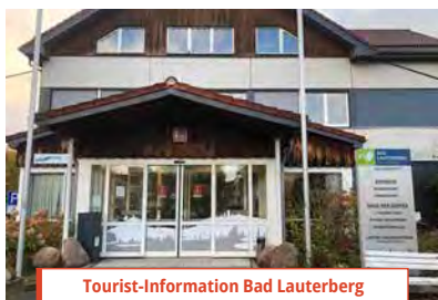
Tourist-Information Bad Lauterberg