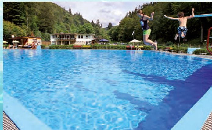
Waldschwimmbad Zorge

Besucher erwartet hier das zweitgrößte Freibad Thüringens mit einem Nichtschwimmerbecken, einem Schwimmbecken sowie dem Wettkampfbereich. Es stehen ein Sprungturm und eine große Wasserrutsche zur Verfügung. Das Waldbad ist Montag bis Freitag 13.00 bis 19.00 Uhr und am Wochenende sowie täglich in den Sommerferien in Thüringen (04.07. bis 14.08.) 11.00 bis 19.00 Uhr geöffnet. Info: 036332 729 468.