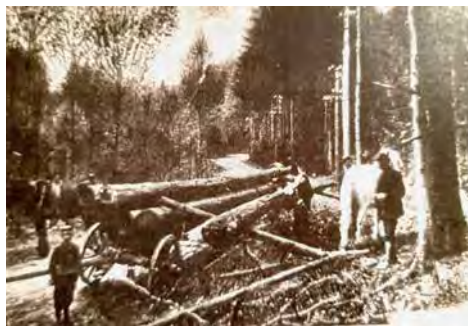
Verladen von Langholz mit Pferdekraft (Archiv)

Ein Beitrag von Harald Winter / Archivgemeinschaft