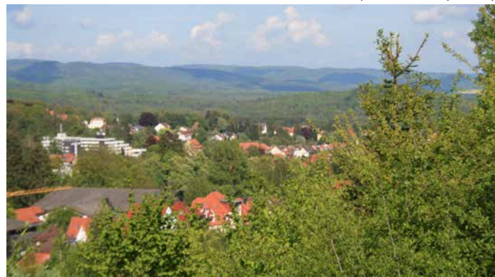
Blick auf Bad Sachsa

des Ravensberges, zu Fossilien sowie zu den heutigen Landschaftsformen und der Tier- und Pflanzenwelt im Südharz. Für diese Führung ist der normale Museumseintritt zu bezahlen (Erwachsene 5,00 €, Kinder bis 12 Jahren 4,00 €, Rabatt mit der Gästekarte).