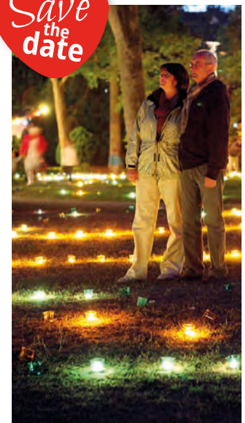
Lichterfest Bad Sachsa

Offset- und Digitaldruck | Layout Werbetechnik