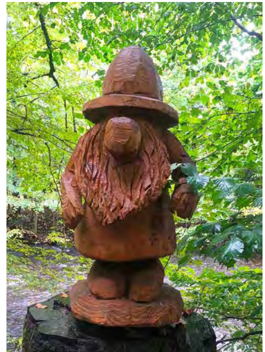
Zwerg „Friedel“

Viel Spaß beim Entdecken und zuhören, egal ob geführt oder auf eigene Faust.