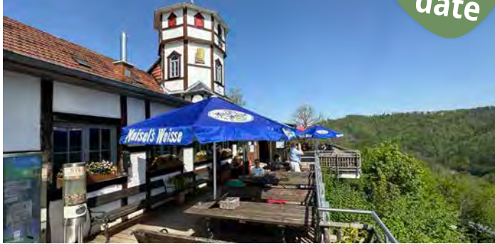
Berggaststätte Hausberg | Foto: © Andreas Stumpf-Dürkop