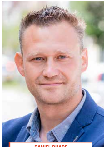
DANIEL QUADE Bürgermeister Bad Sachsa