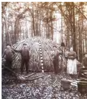
Bild von einem Meiler, Köhler bei der Arbeit zu einem Meiler um 1900

So z.B. waren die Lauterberger Köhler Bährens, Engelke, Specht und Vet-