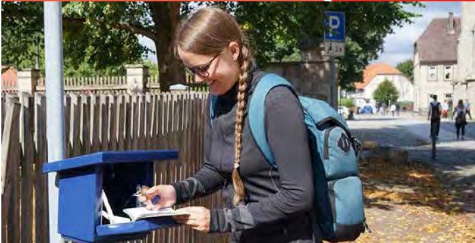
Blauer Stempelkasten